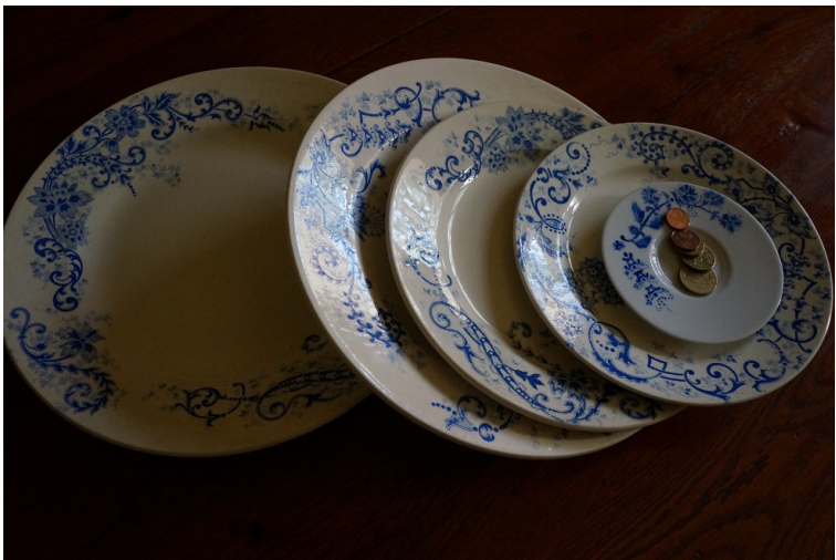
les assiettes originales de mémé... son héritage pour accompagner le don transmis

Mémé installe devant Suzanne les assiettes bleues que je conserve encore aujourd'hui....et qui illustrent mon propos.