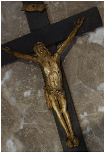
A la mémoire de pépé